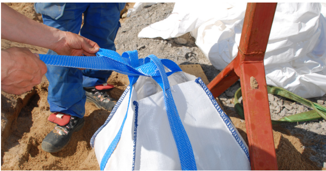
2. Pujota sitomisliina ankkurointisäkin hihnojen läpi ja pujota lopuksi läpi liinan oman lenkin läpi ja kiristä.