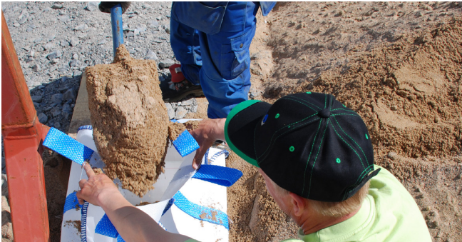
1. Ankkurointipussit voidaan täyttää lapiomalla täytemaata tai valamalla betonia säkkeihin.