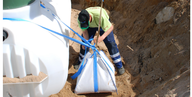
5. Sido liina tiukasti vastakkaisen puolen ankkurointisäkkiin.