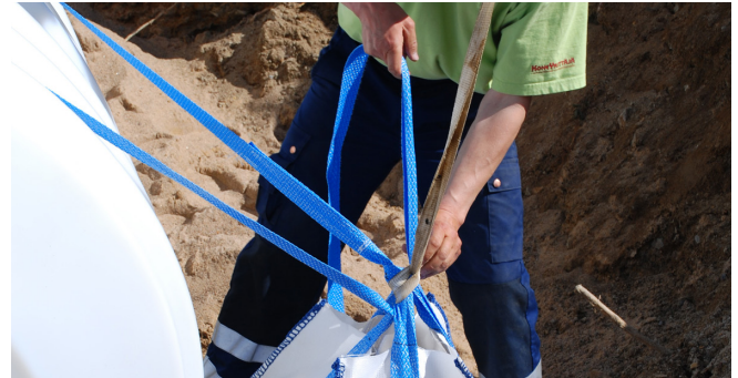
6. Liinan pituus 5m riittää hyvin ankkurointiin puolelta toiselle.