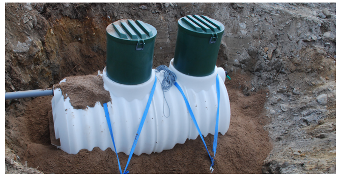
7. Täytä kaivanto saloajahiekalla 12-20 cm paksuisin kerroksittain tiivistämällä.