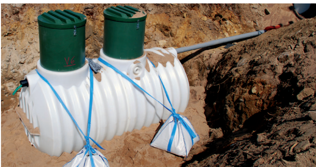
4. Ankkurointi kiinnitetään ristiin säiliön molemmin puolin.