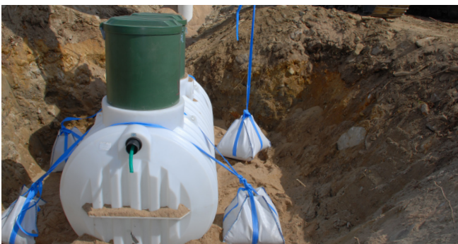
3. Täysiä ankkurointisäkkejä on helpoin liikutella työkohteilla.