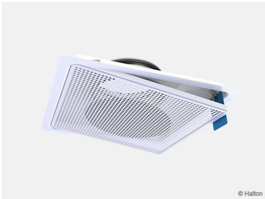
Kuva 8. Avaa ohuella muovilevyllä.

Sulje etulevy painamalla sitä, kunnes kiinnitysjouset lukittuvat.