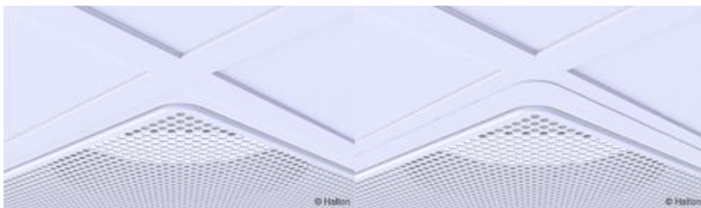
Kuva 5. Asennettuna listan alapuolelle

Hajottaja on saatavana 595 x 595 kokoisena, ja se voidaan asentaa suoraan modulaariseen alakattoon (600 x 600).