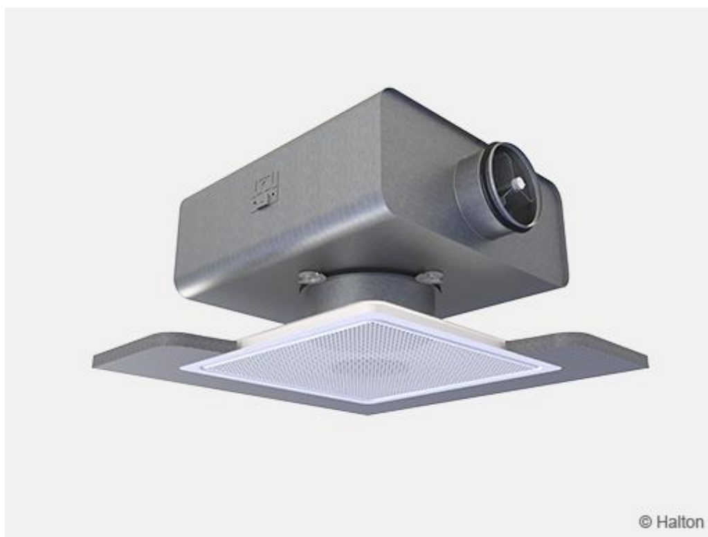
Kuva 7. Asennus Halton TRI -liitântälaatikon kanssa

Halton Jaz Rain Ceiling-hajottajan ja Halton TRI -liitântälaatikon tekninen suorituskky esitetään erikseen näissä kahdessa asennustapauksessa