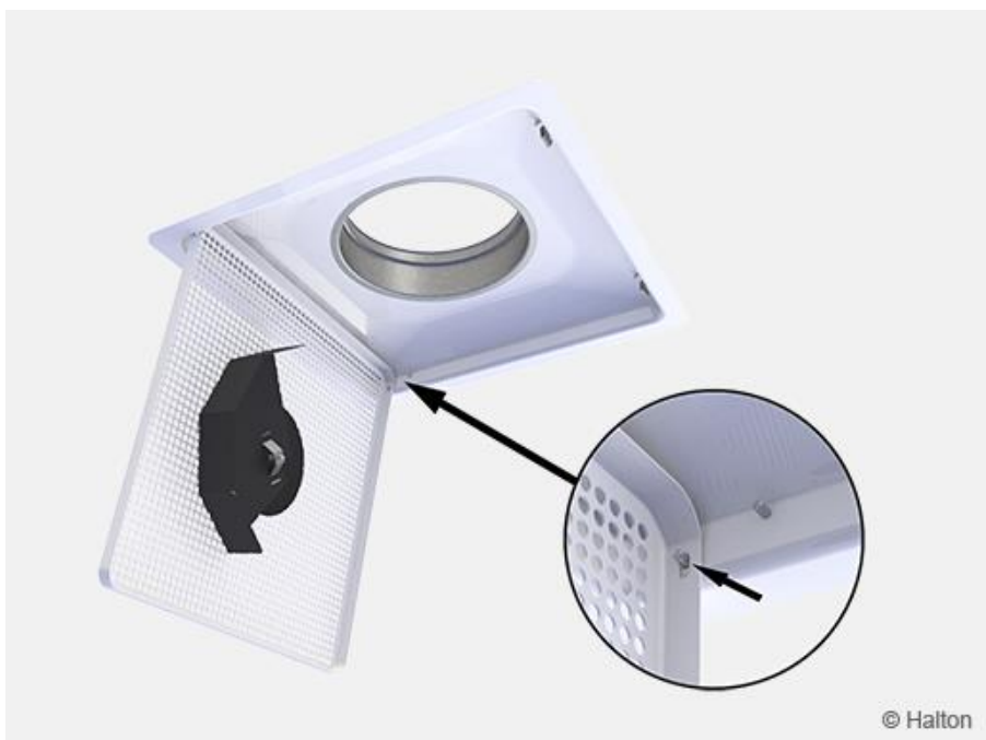
Kuva 9. Paina saranatappia sisäpuolelta.