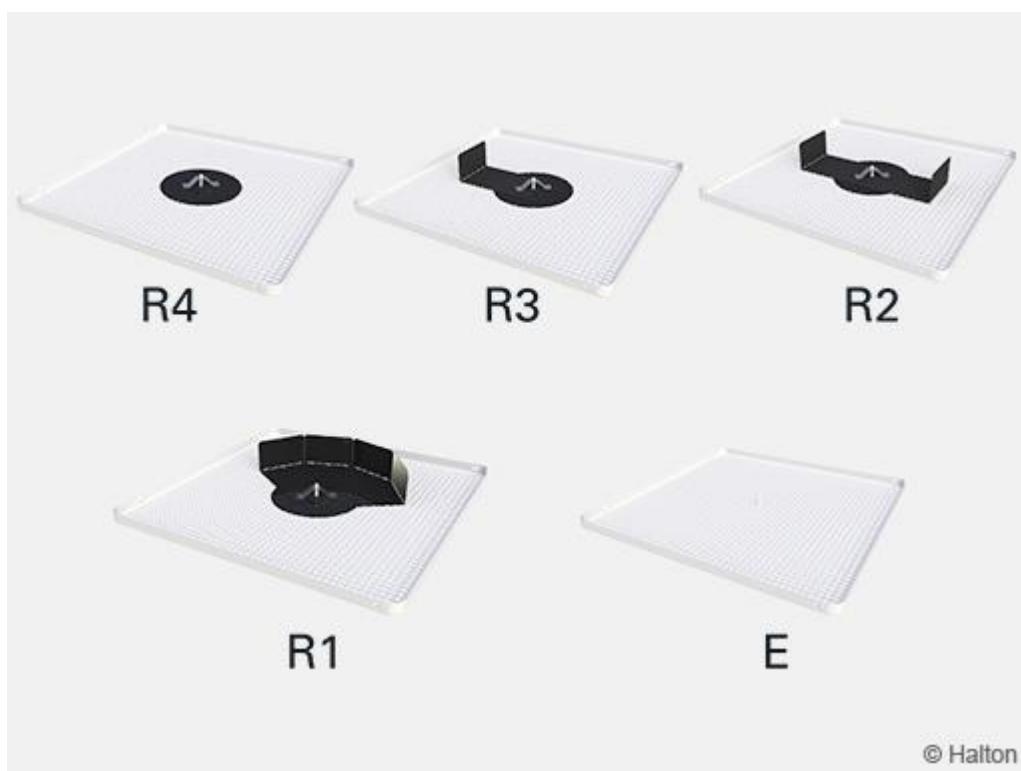
Kuva 6. Suuntauslevyvaihtoehdot

Suuntaa ilmasuihkut haluamiisi suuntiin asentamalla suuntauslevyt (kuva 3) rei'itettyyn etulevyyn, jotta saavutat haluamasi ilmajaon (vakiotoimitukseen kuuluu R4, kts. kuva 6.).